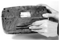
Cleaning slot at the base