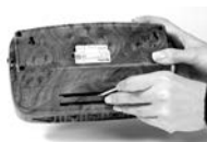
Orifice pour nettoyage dans le socle